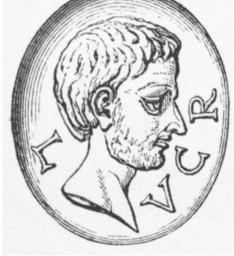
Fig. 1. Profilo di uomo barbato inciso su agata nera con l'iscrizione LVCR. I sec. a.C.

uomo barbato inciso su una gemma di agata nera con l'iscrizione LVCR (fig. 1) che nei primi anni '30 del diciannovesimo secolo il filologo tedesco Karl Otfried Müller identificò senza esitazioni con Lucrezio. 19 Nella seconda metà del secolo l'autenticità dell'attribuzione veniva confermata da un'expertise realizzata a cura dell'Istituto Archeologico di Roma e dall'esperto di gemme antiche Charles William King. 20 L'autorità di King indusse Hugh A. J. Munro a pubblicare nel 1866 un'incisione della gemma sul frontespizio della sua celebre edizione del De rerum natura . 21 Nel 1882 l'autenticità della gemma veniva messa